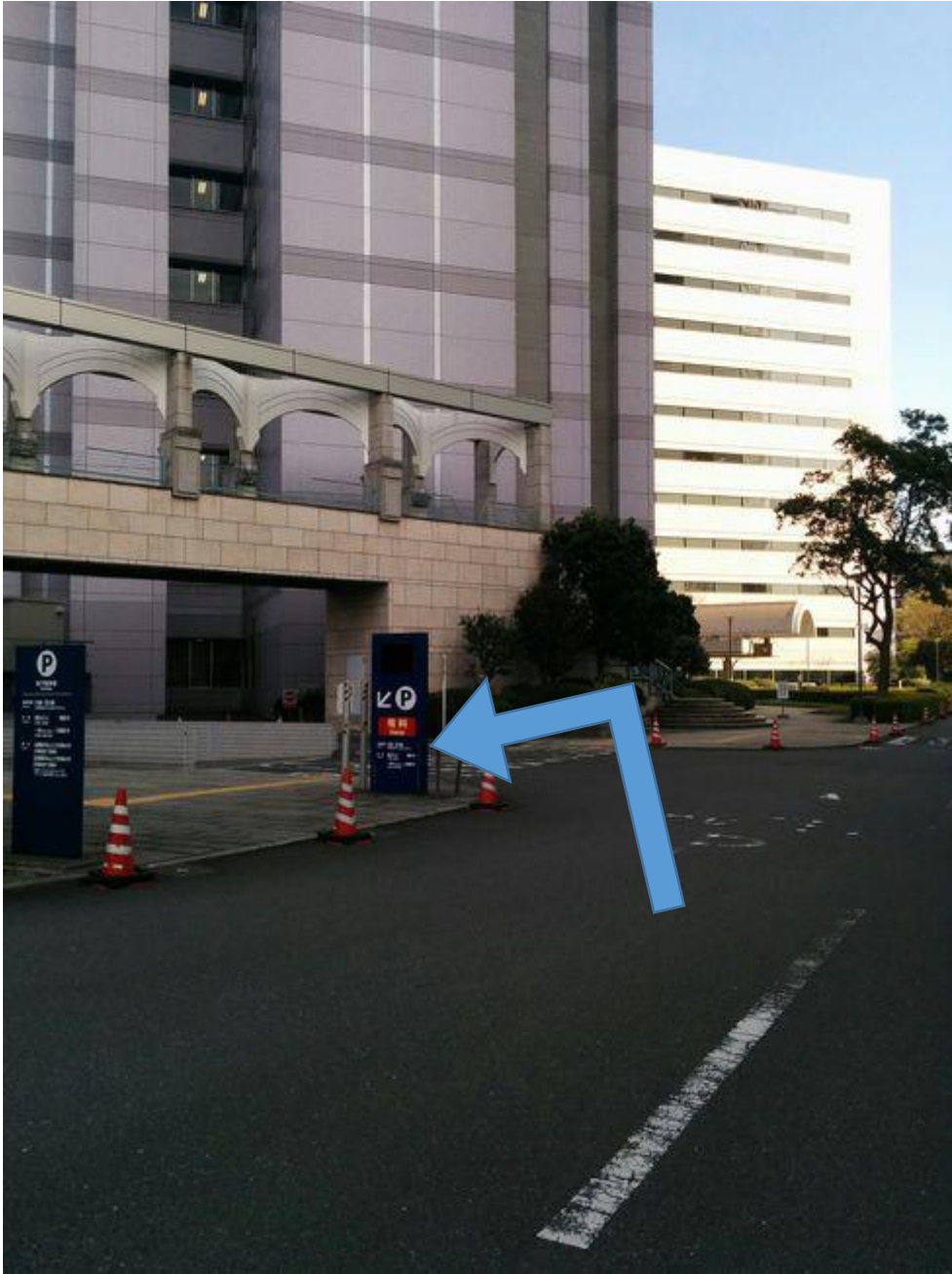
地下駐車場の手前で曲がります。